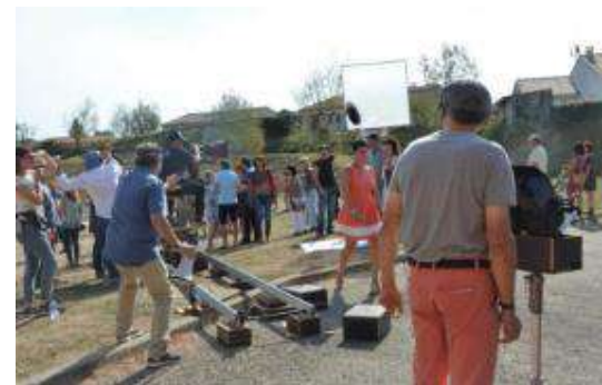
Visite de tournage à Bram

□ C'est un des Enseignements Optionnels. Les élèves peuvent choisir 2 options + latin