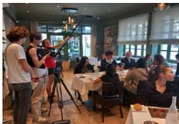
ou en extérieur