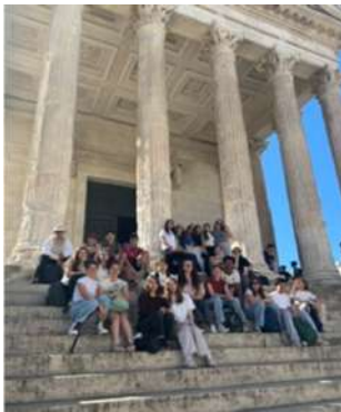
Gruppe d'élèves devant la maison carrée à Nîmes