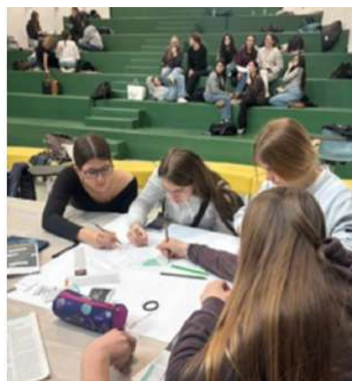
Travail de groupe en échange Erasmus à Milan