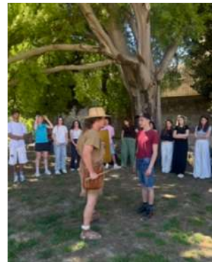
Leçon de gladiature aux arènes d'Arles