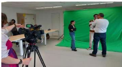
Tournage au lycée ...