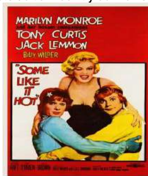
Des sorties au cinéma

□ Des déplacements auront exceptionnellement lieu pour des sorties au cinéma, festivals, des tournages en extérieur, des rencontres, à Castelnaudary ou dans les environs, en fonction des projets de l'année. Il y a au moins une sortie à la journée ou voyage par an.